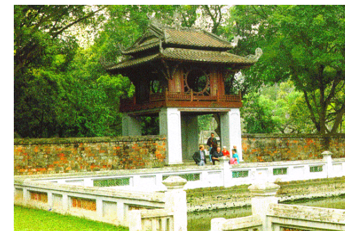
Train Orient Express ou un equivalent