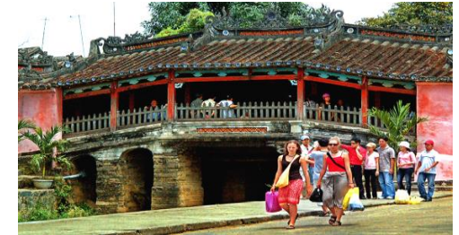
Van Loi hotel***