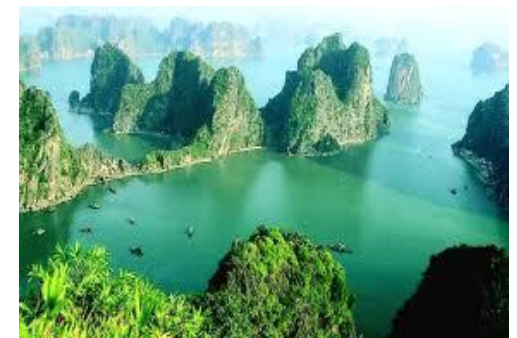
Jonque de luxe Image Halong Cruise***

En soirée: vous pouvez vous détendre ou faire de la pêche. Nuit à bord de la jonque.