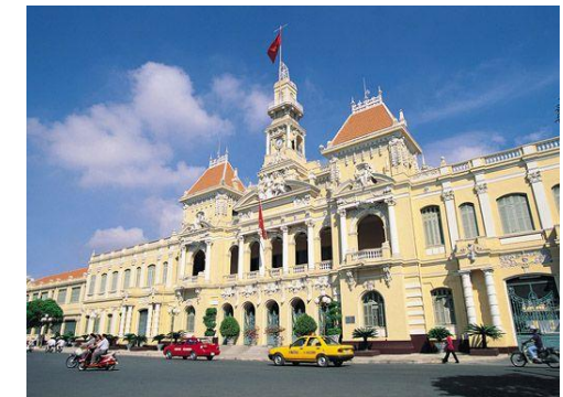
Ruby River hotel***